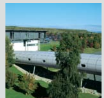
La central de Viessmann en Allendorf, con el museo de la empresa: Via Temporis