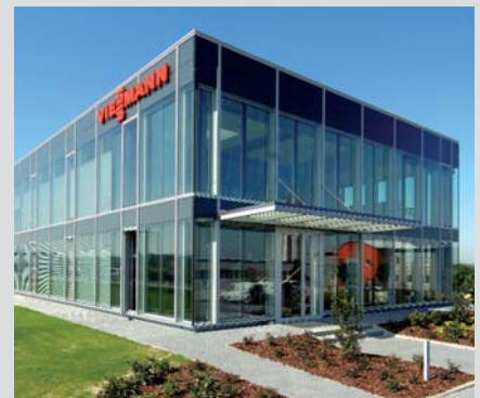
Delegaciones de Viessmann: 112 en todo el mundo