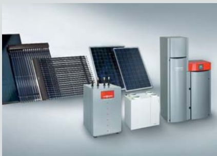
Sistemas de energías renovables para el aprovechamiento del calor ambiental, la energía solar y la biomasa