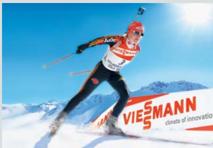
Viessmann apoya la consecución de todo tipo de logros, también los deportivos