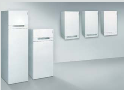
Calderas murales para gasóleo y gas con tecnología calorífica y de condensación

En Viessmann, todos los productos están perfectamente armonizados entre sí, por lo que ofrecen la máxima eficacia: Desde la planificación hasta el manejo.