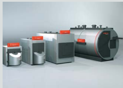
Calderas de pie para gasóleo y gas con tecnología calorífica y de condensación